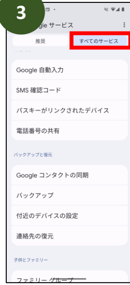
「すべてのサービス」を タップ