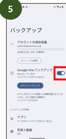
「Google Oneバックアップ」 の赤枠内にあるボタンを タップ