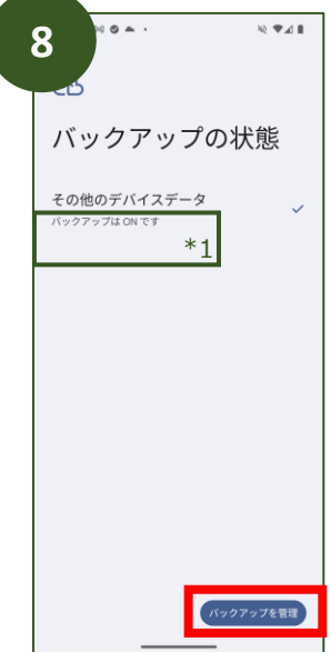
「バックアップを管理」を タップ

*1 削除する際一時的にOFFになりますが、 削除後は自動的にバックアップが再開されます。