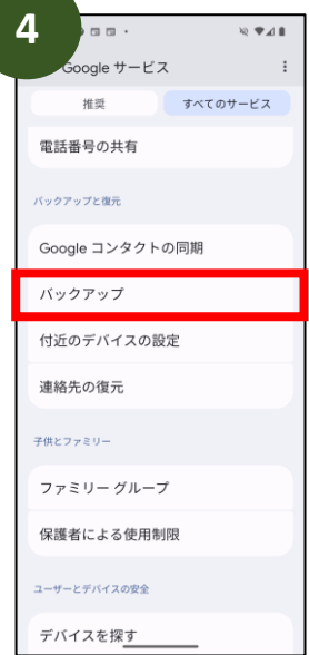
「バックアップ」を タップ