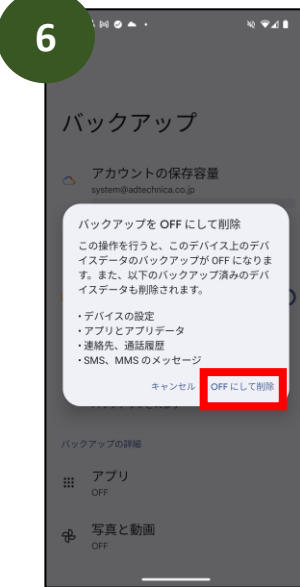
「OFFにして削除」を タップ *1